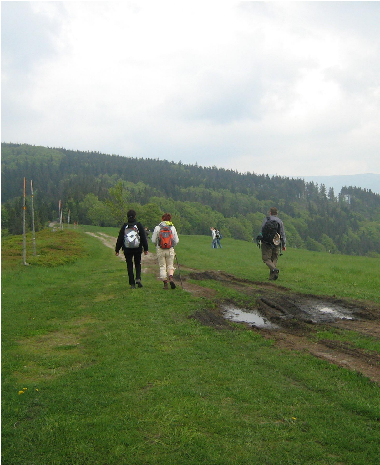
Beskidzka Droga św. Jakuba